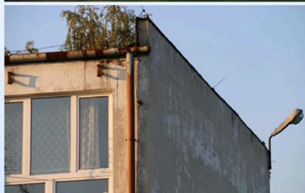
Zespół Szkół Zawodowych nr 3