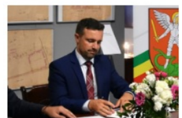
Michał Litwiniuk prezydent Białej Podlaskiej