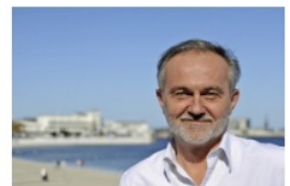
Wojciech Szczurek prezydent Gdyni

- Bardzo miłe informacje w niedzielny wieczór. Zostałem nominowany do