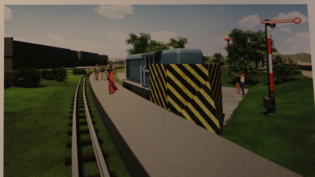
Peron osobowy z pługiem odśnieżnym