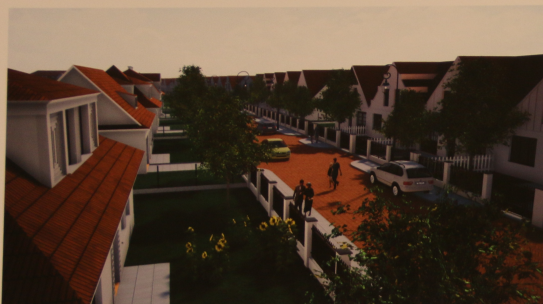
Fragment projektowanej ulicy na południowo-zachodniej części obszaru opracowania