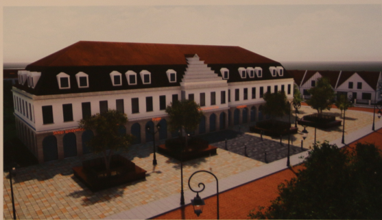
Projektowany plac miejski oraz Dom Kultury