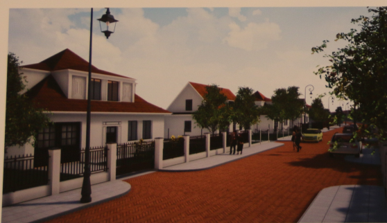
Projektowana zabudowa jednorodzinna wolnostojąca