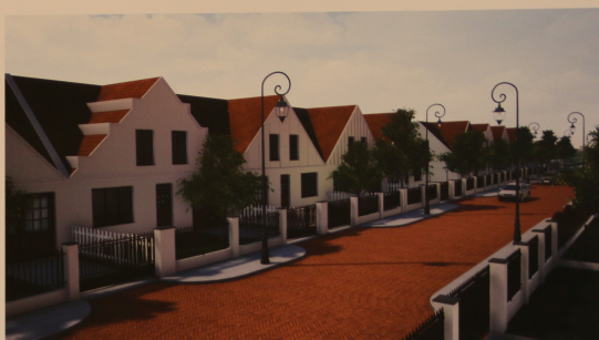
Projektowana zabudowa szeregowa