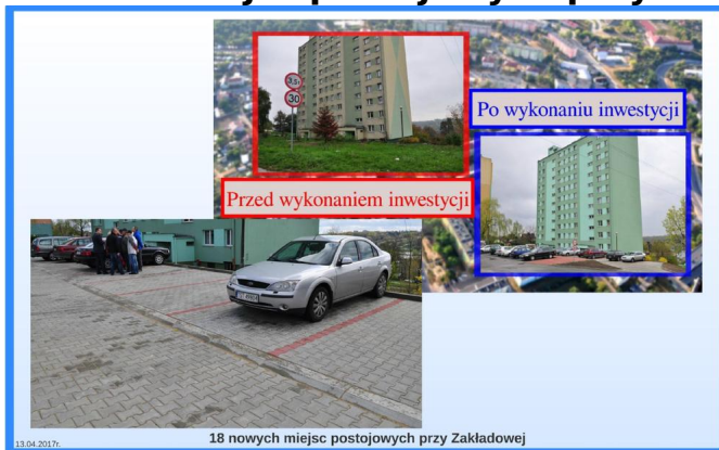
18 nowych miejsc postojowych przy Zakładowej

Cel: Budowa miejsc postojowych dla samochodów osobowych. Poprawa bezpieczeństwa ruchu drogowego oraz wizerunku modernizowanego terenu przy ul. Zakładowej.