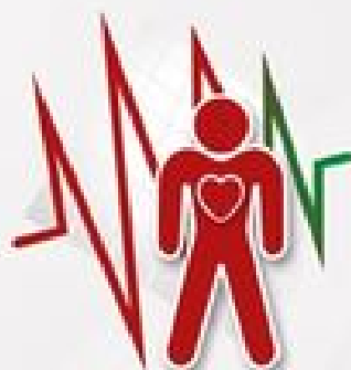
PRZYSPIESZONA CZYNNOŚĆ SERCA