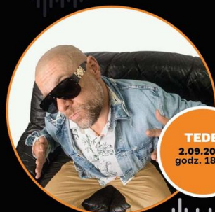
TEDE 2.09.2023 godz. 18:30