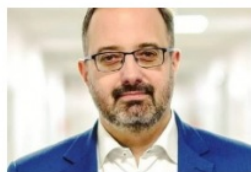
Łukasz Konarski prezydent Zawiercia