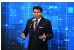
Lucjusz Nadberezny prezydent Stalowej Woli