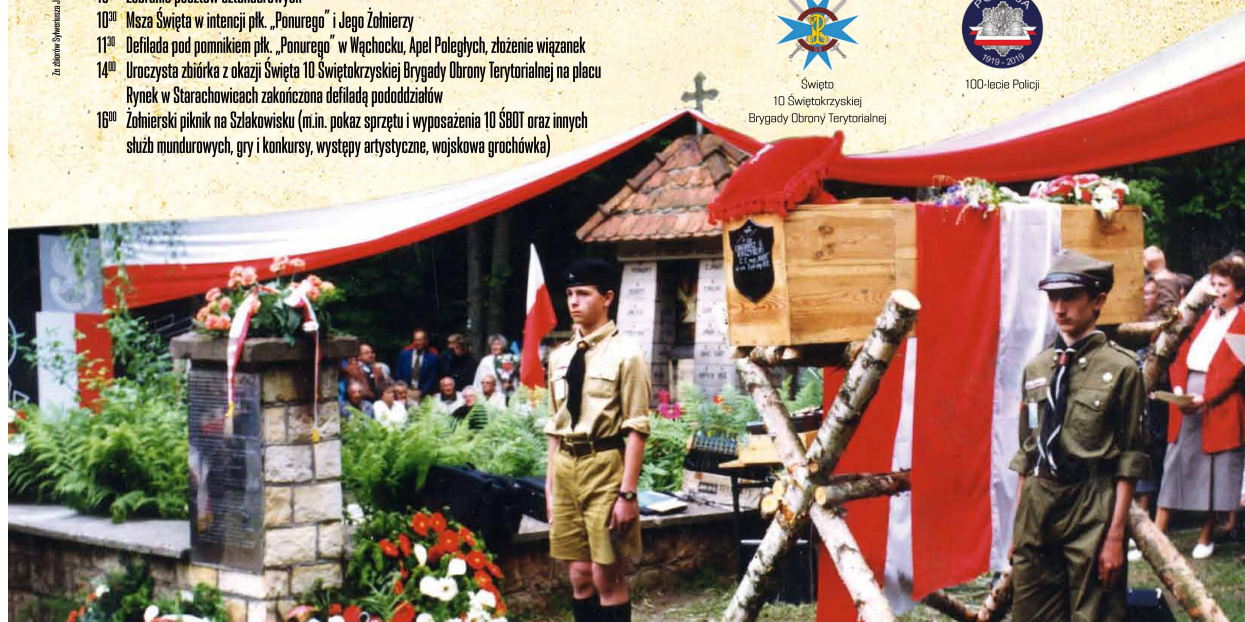
Wspieracie organizacyjnie i finansowo w organizacji uroczystości