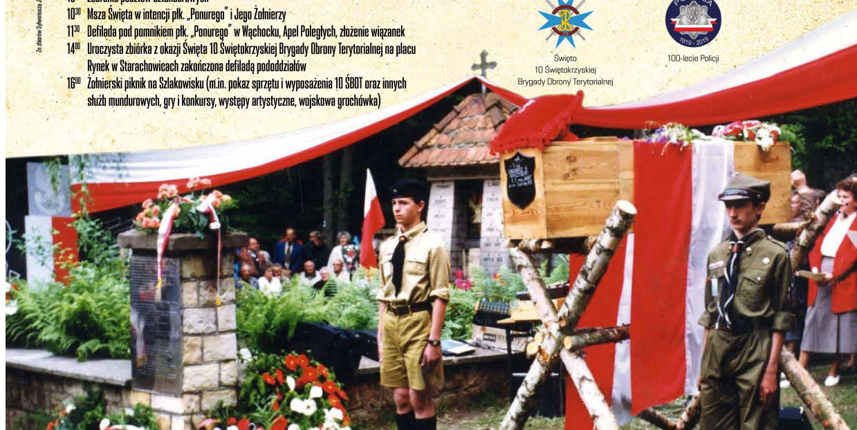
Wspiercy organizacyjnej i finansowej w organizacji uroczystości

Za obraz: Dymitrakos, Internet.org ps. „Szamaj”