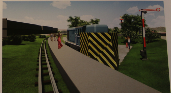
Peron osobowy z pługiem odśnieżnym