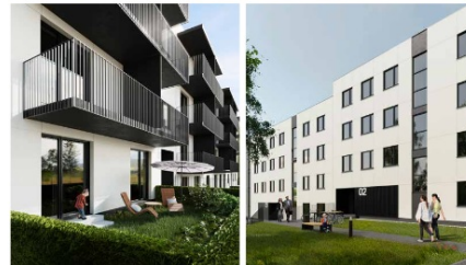
Zespół budynków mieszkalnych