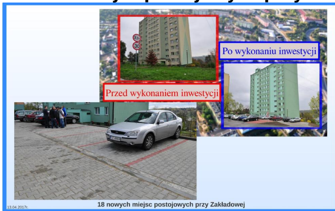
18 nowych miejsc postojowych przy Zakładowej

Cel: Budowa miejsc postojowych dla samochodów osobowych. Poprawa bezpieczeństwa ruchu drogowego oraz wizerunku modernizowanego terenu przy ul. Zakładowej.