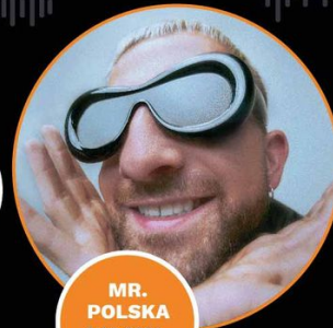
MR. POLSKA 2.09.2023 godz. 20:00

STREFA GASTRO STREFA PARTNERÓW MŁODZIEŻOWY ART PATROL STREFA AKTYWNOŚCI PARK ROZRYWKI