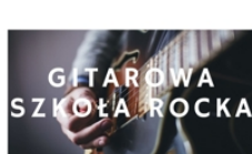
PROWADZI KRZYSZTOF STANIK