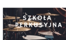
PROWADZI GRZEGORZ DZIAMKA