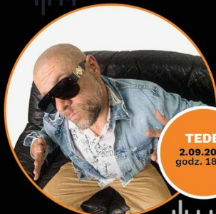
TEDE 2.09.2023 godz. 18:30