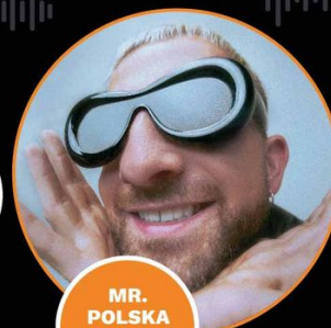
MR. POLSKA 2.09.2023 godz. 20:00

STREFA GASTRO STREFA PARTNERÓW MŁODZIEŻOWY ART PATROL STREFA AKTYWNOŚCI PARK ROZRYWKI