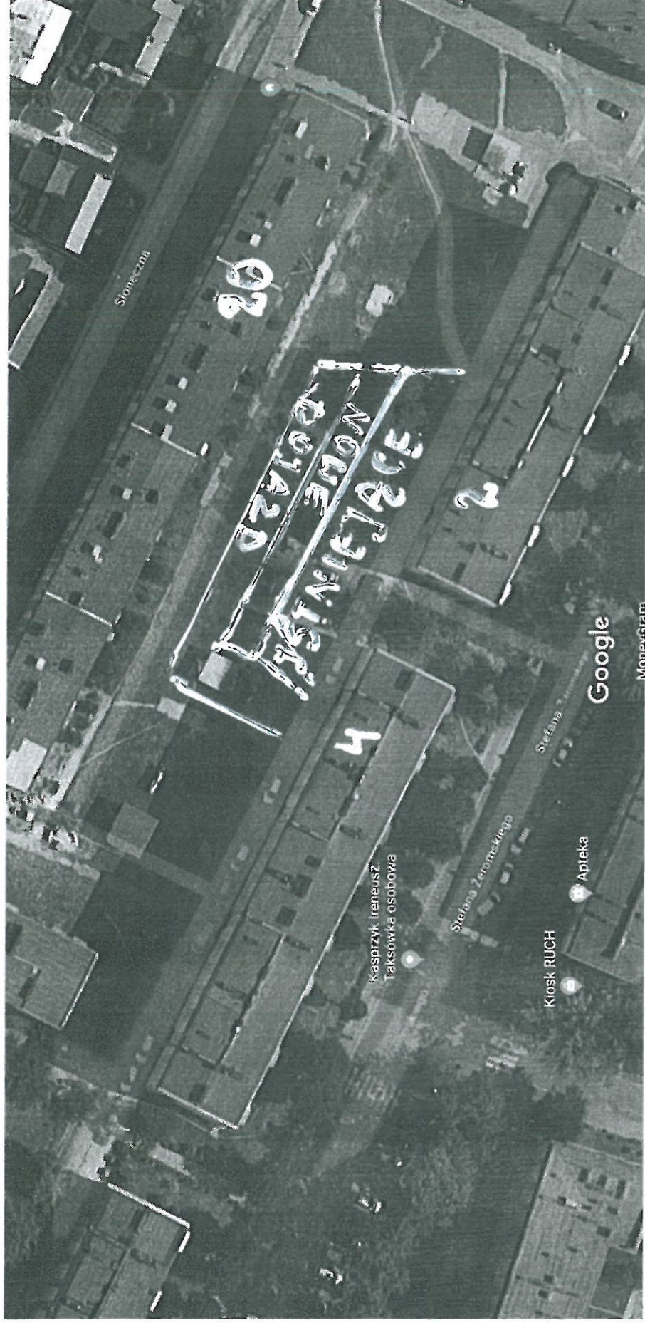
Zdjęcia ©2018 Google, Dane mapy ©2018 Google 10 m