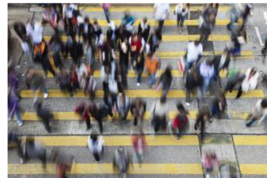
The Sustainable Business Exchange