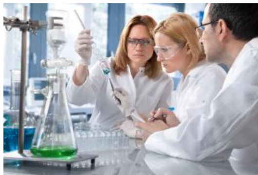
European Pact for Youth