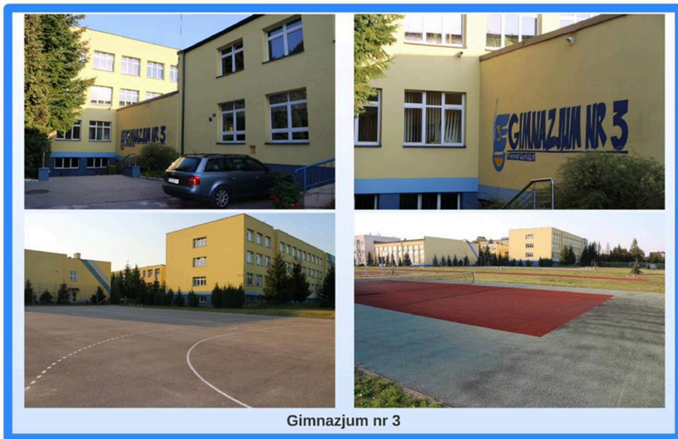
Gimnazjum nr 3