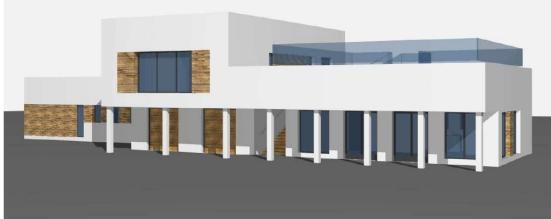
WIDOK OD POLUDNIOWEGO-WSCHODU