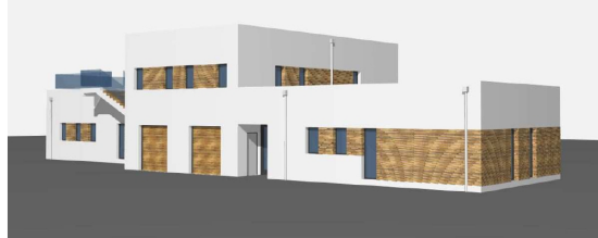
WIDOK OD PÓLNOCNIEGO-ZACHODU