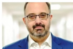
Łukasz Konarski prezydent Zawiercia