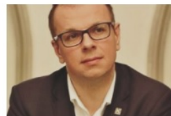
Wojciech Bakun prezydent Przemyśla