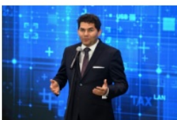
Lucjusz Nadberezny prezydent Stalowej Woli