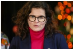
Aleksandra Dulkwicz prezydent Gdańska