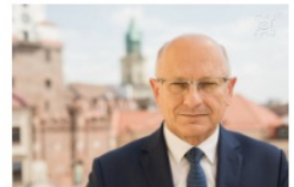
Krzysztof Żuk prezydent Lublina